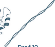
Der f 10 Tropomyosine