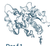
Der f 1 Protéase à cystéine