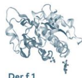
Der f 1 Protéase à cystéine