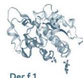
Der f 1 Protéase à cystéine