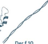
Der f 10 Tropomyosine