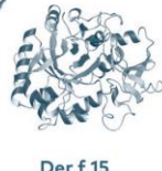
Der f 15 Chitinase