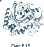
Der f 15 Chitinase