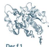
Der f 1 Protéase à cystéine